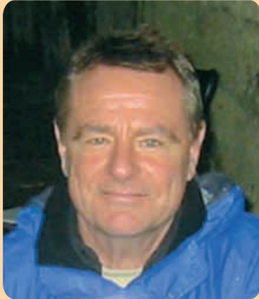
Michael Bischoff Herbergstr. 1 82237 Wörthsee / Steinebach

Tel.: 08153 – 98 69 33 Fax: 08153 – 98 69 32 info@mtb-geobiologie.de www.mtb-geobiologie.de